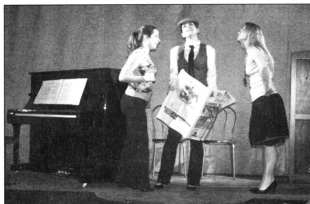
Les deux jeunes filles se disputent leur "chéri"